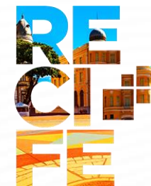
Legenda da imagem